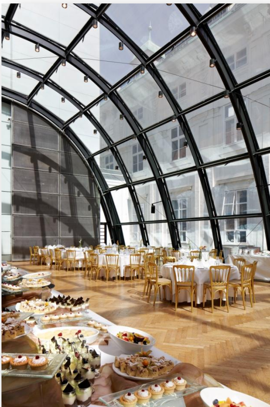
HOFBURG GALERIE