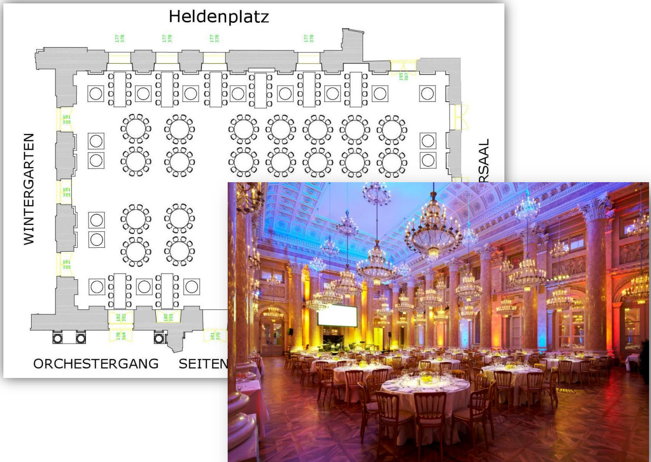
ZEREMONIENSAAL © HOFBURG Vienna, Foto: M. Seidl